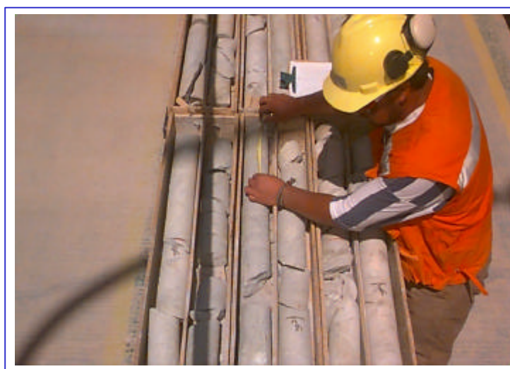
Figura 2.1. Medición del RQD

La frecuencia de fractura se determina considerando solamente las fracturas naturales, que existen sobre el soporte de estudio (1.5m), y se reúnen en tres grupos, donde se suman todas aquellas cuyo manteo mide entre 0° y 30°, otro grupo para las que miden entre 31° y 60°, y finalmente entre 60° y 90°; y además se aprovechan para definir la frecuencia de fractura, entonces se suman los tres grupos y se dividen por el intervalo de 1.5 m.